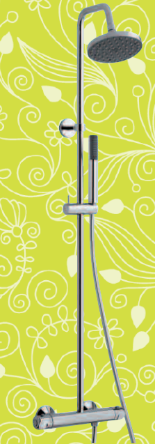
COLONNE DE DOUCHE