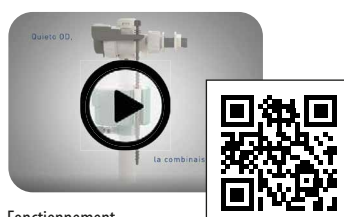
Fonctionnement robinet Quieto OD