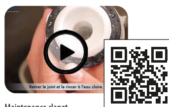
Maintenance clapet mécanismes SIAMP

*Calcul réalisé pour une famille de 4 pers.