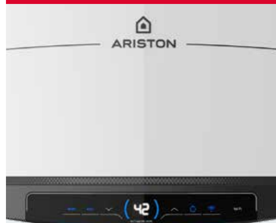
TABLEAU DE COMMANDE INTELLIGENT